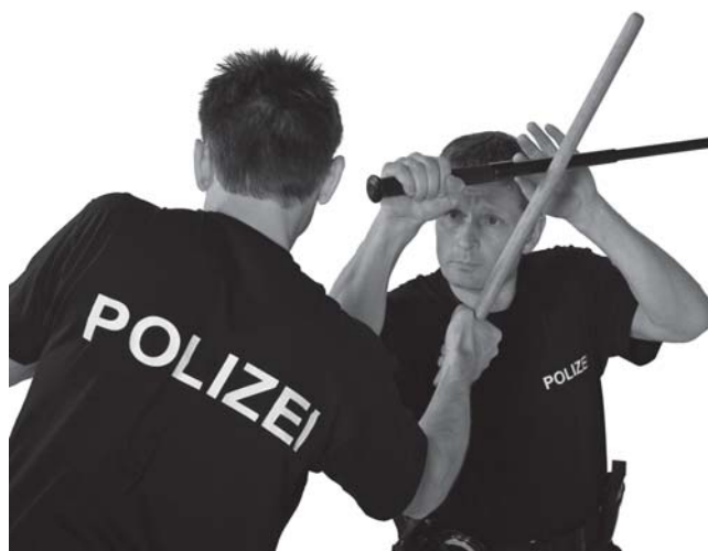
> ...hier ein Angriff zum Kopf, der mit dem Dachblock (Roof Block) gekontrolliert wird.

Der TKS kann mit Hilfe der richtigen Anwendung von Mimik und Gestik im Vorfeld eines