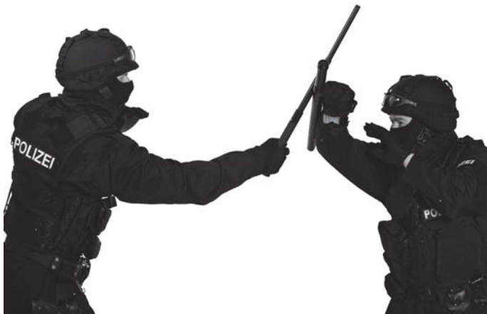
> Bei den Spezialkräften ist der neue Schlagstock schon seit vielen Jahren Mannausstattung.

Daher empfiehlt es sich in diesen Einsatzlagen auf die Gelenke, z. B. auf die Schulter, den Ellenbogen oder zum Schlüsselbein zu schlagen. Dies führt