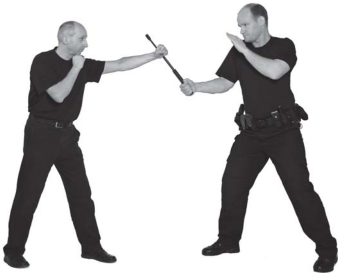
> Der Teleskopschlagstock wird mit der richtigen Technik vorrangig auf die großen Muskelgruppen und die Hände des Angreifers eingesetzt.

Techniken dürfen nur in Ausnahmefällen Anwendung finden und auch dabei muss der Polizist damit rechnen, dass die Stopp-Wirkung ausbleibt. Alkoholisierter oder unter Drogeneinfluss handelnde Personen sowie Menschen, die in Rage geraten und zusätzlich durch eine starke Endorphinausschüttung bedingt, schmerzreduziert oder gar -unempfindlich agieren, können trotz solcher lebensbedrohlichen Verletzungen weiterhin handlungsaktiv bleiben.